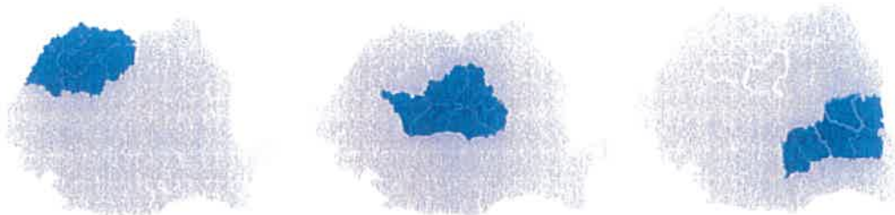
Figura 1. Harta de distribuție a energiei electrice de către DEER

Misiunea principală definită a DEER este aceea de a furniza serviciul de distribuție a energiei electrice tuturor clienților, la parametrii de calitate stabiliți de ANRE și în conformitate cu standardele naționale și internaționale relevante pe piața de energie, în condiții de siguranță, continuitate, accesibilitate și sustenabilitate.