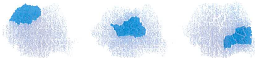
Figura 1. Harta de distribuție a energiei electrice de către DEER

Misiunea principală definită a DEER este aceea de a furniza serviciul de distribuție a energiei electrice tuturor clienților, la parametrii de calitate stabiliți de ANRE și în conformitate cu standardele naționale și internaționale relevante pe piața de energie, în condiții de siguranță, continuitate, accesibilitate și sustenabilitate.